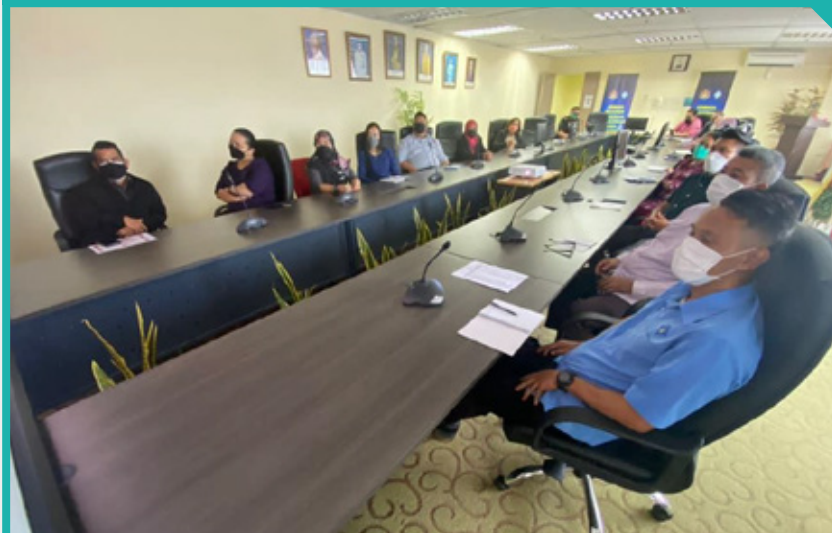
Kakitangan LPKP Sarawak yang hadir secara fizikal bagi mendengar ceramah