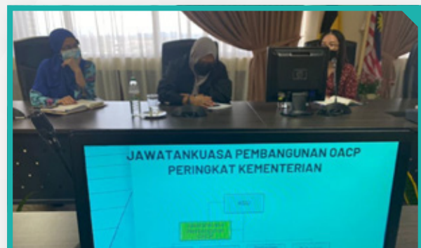
Slaid pembentangan bagi penerangan mengenai Pelan Anti Rasuah Organisasi (OACP)